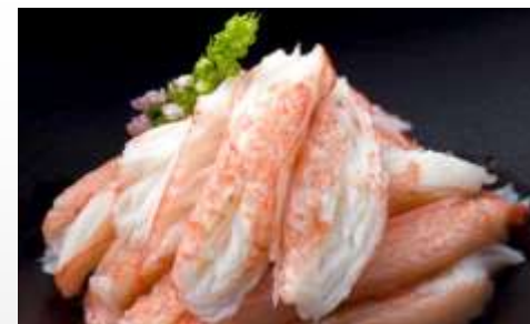
第45回天皇杯受賞商品 香り箱